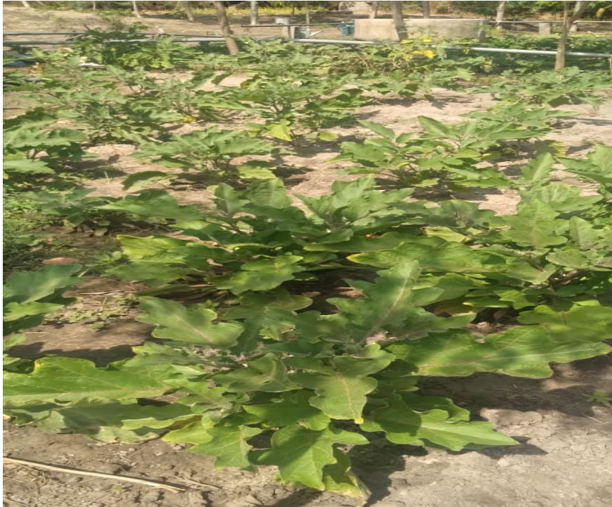
Figure 4 Parcelle d'Aubergine Douce

Les aubergines sont repiquées le 02 octobre 2022. Les plantes sont saines et suivent une croissance normale mais on note des attaques causées par des singes. Au total, les 120 pieds ont donné 17kg avec un prix de 300f le kg