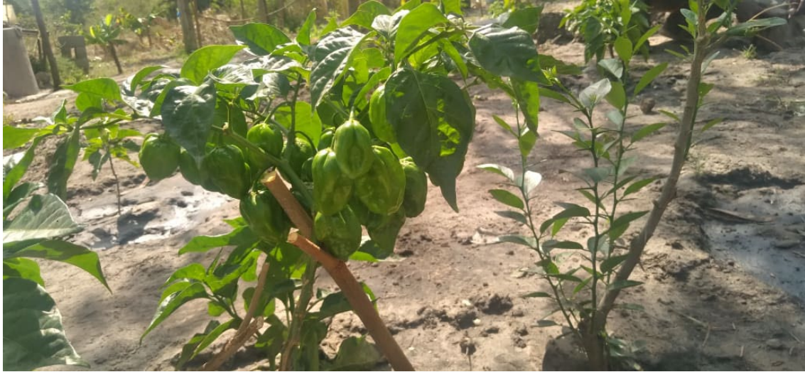
Figure 2 Plante de Piment

Comme le poivron, le piment repiqué le 14 septembre 2022 a eu un bon taux de reprise. Sa croissance est un peu lente dans l'ensemble. Cependant certaines plantes ont commencé à produire. Sur les 300 pieds, juste 1,3 kg sont récoltés à ce jour, vendu au marché pour le prix de 2000f le kg. Il est impératif d'apporter une source d'éléments minéraux aux plantes.