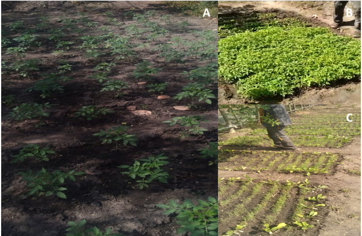
Figure 5 parcelle tomate (A) pépinière tomate et poivron (B) pépinière oignon (C)