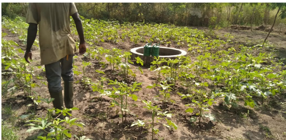
Figure 3 Parcelle Gombo

Le gombo semé le 20 septembre 2022 résiste plus au manque de nutriment. A ce jour, 83 kg sont récoltés vendu au prix qui varie entre 800 et 1000f le kg